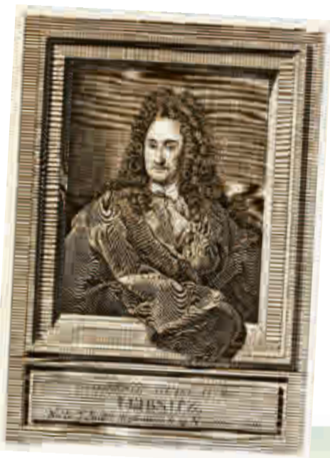
Grabado francés de Leibniz, 1768.

Leibniz, uno de los mayores, más sensibles y prolíficos filósofos ve ahora editada en castellano una parte importante de su obra bajo la edición del valenciano Agustín Andreu, quien a los 88 años muestra un vigor intelectual extraordinario.