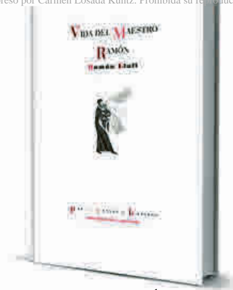
VIDA DEL MAESTRO RAMÓN