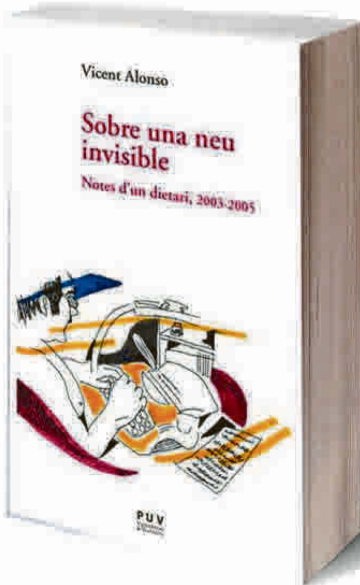
SOBRE UNA NEU INVISIBLE. NOTES D'UN DIETARI 2003-2005