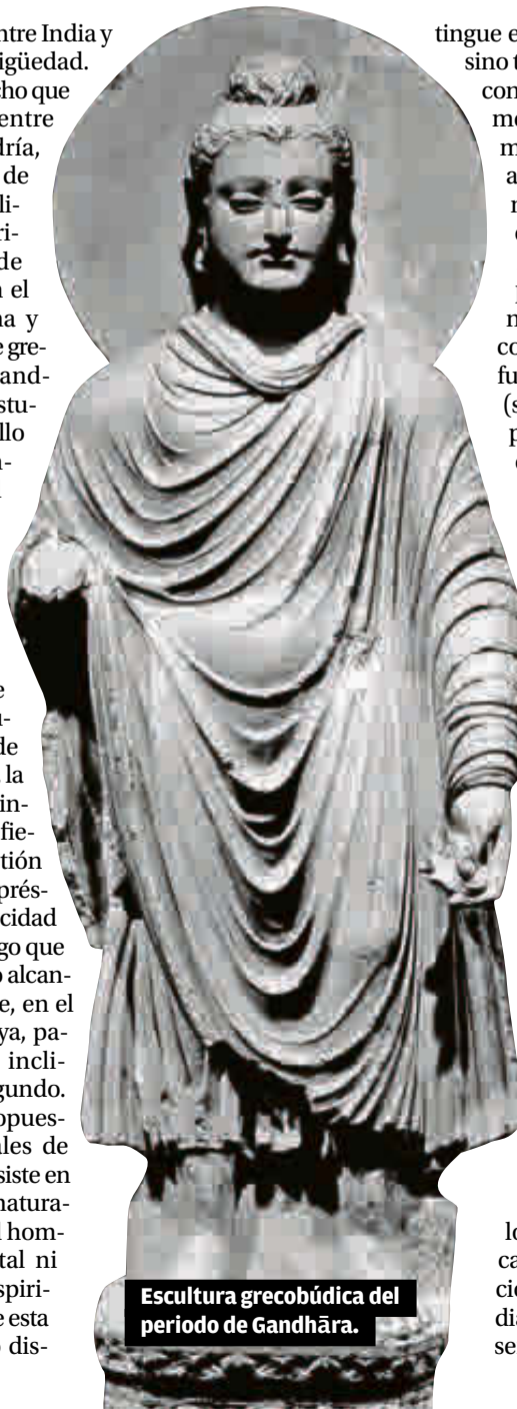
Escultura grecobúdica del periodo de Gandhāra.

tingue entre mente y materia, sino también entre mente y conciencia. Me explico. La mente está hecha de una materia sutil y es anterior a lo que hoy llamaríamos materia física, que es una consecuencia de la anterior. Pero ambas pertenecen al mundo natural, mientras que la conciencia se encuentra fuera del mundo natural (si esto puede decirse así pues la conciencia no ocupa «lugar» y esto es algo muy difícil de entender desde Newton). Una conciencia pura y libre de toda limitación. Una conciencia a la que da contenido la propia naturaleza, el mundo físico y mental. Identificar la conciencia con el complejo psicofísico del individuo supone un gran error y la principal fuente de complicaciones para el hombre. Deshacer esa identificación ilusoria es el propósito de esta filosofía, que enseña a distinguir lo manifestado de aquel que conoce lo manifestado. En este sentido el sāmkhya, como el resto de sistemas filosóficos indios, es un camino de autorrealización. La filosofía en la India si no se vive carece de sentido.